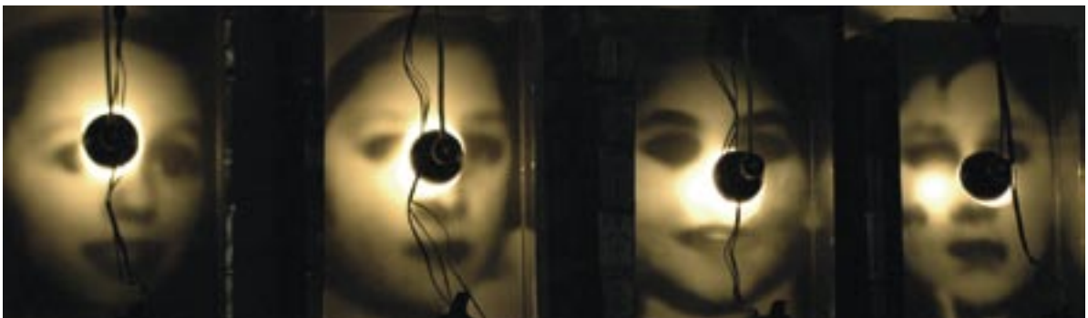
Abb. 6.4: Ausschnitt einer Installation von Christian Boltanski: „Réliquaire“ von 1990 im Zentrum für Kunst und Medien (ZKM) Karlsruhe zur Erinnerung an Opfer des Dritten Reichs.

„Eine schlechte Nachricht hat immerhin auch den Anstoß für die ernsthafte Kreativitätsforschung geliefert – der Start des ersten sowjetischen Sputnik am 4. Oktober 1957. Nach diesem Schock pumpte Washington Millionen von Dollar in die Sozialwissenschaften und die Intelligenzforschung. Bis Mitte der 70er Jahre wurden ganze Serien von Tests entwickelt und nahezu alle Persönlichkeitszüge isoliert, die es zur Kreativität braucht.“ (Fischer; Risch, Kinder, 1993, S. 212)