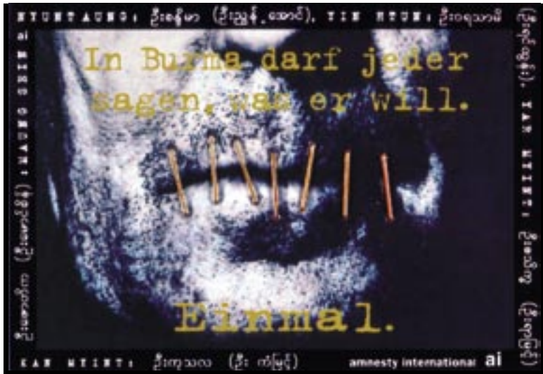
Abb. 6.3: „In Burma darf jeder sagen, was er will. Einmal.“ (Kampagne von amnesty international, Postkarte)

Der Brockhaus von 1955 bringt es denn auch knapp und präzise auf den Punkt: „Kreation (lat.), die, Schöpfung; Gestaltung.“ Das englische „creative“ bezeichnet „schöpferische Ideen habend und diese gestalterisch verwirklichend“. Die Kreativität ist, nach dem ZEIT-Lexikon 2005, die schöpferische Kraft und das kreative Vermögen. Sprachwissenschaftlich schließlich bezeichnet man damit das mit der sprachlichen Kompetenz verbundene Vermögen, neue, nie gehörte Sätze zu bilden und zu verstehen. Kreativität ist also, nach europäischem Verständnis, ein schöpferisches, gestalterisches Vermögen, das sich sprachlich z. B. in der Kreatur (dem Geschöpf und Lebewesen) niederschlägt. Allerdings gibt es eine Erweiterung, die von der Kreativität zu den hier besprochenen Kreativitätstechniken führt: