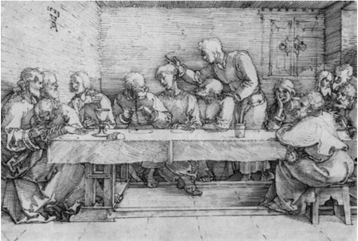
Abb. 3.15 a: Die Grundfragen der Semiotik und Hermeneutik: Was ist tatsächlich zu sehen und zu beschreiben, was wissen wir und bringen wir als Vorwissen mit? (Albrecht Dürer: Abendmahl Christi, 1523, Feder auf Papier.)