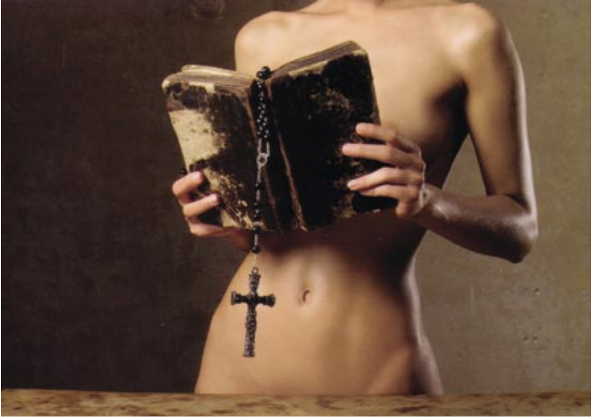
Abb. 3.15 b: Auch bei aktuellen Bildbeispielen stellen sich die gleichen Grundfragen der Semiotik und Hermeneutik: Was ist tatsächlich zu sehen, was bringen wir als Vorwissen mit, wie interpretieren wir die bekannten Zeichen und Symbole im jeweiligen Kontext? (Werbepostkarte, Auflösung in Tab. 3.10)