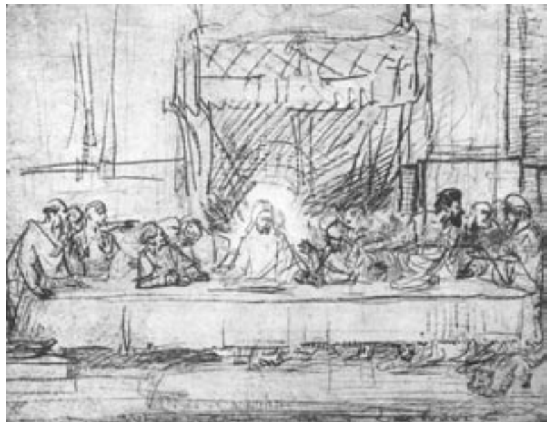
Abb. 3.16: Als Beispiel für die Vielfalt der gestalterischen Ausdrucksmittel sehen Sie zwei weitere Blätter zum Thema „Abendmahl“. Links: Meister des Hausbuches: Das Abendmahl, um 1480–1485, Mischtechnik, Holz; rechts: Rembrandt Harmensz. van Rijn: Das Abendmahl, um 1533–1635, Rote Kreide. Wenden Sie die semiotischen Begriffe aus der Tabelle auf die Bildbeispiele an. Das Thema bleibt, was ändert sich, was nicht?